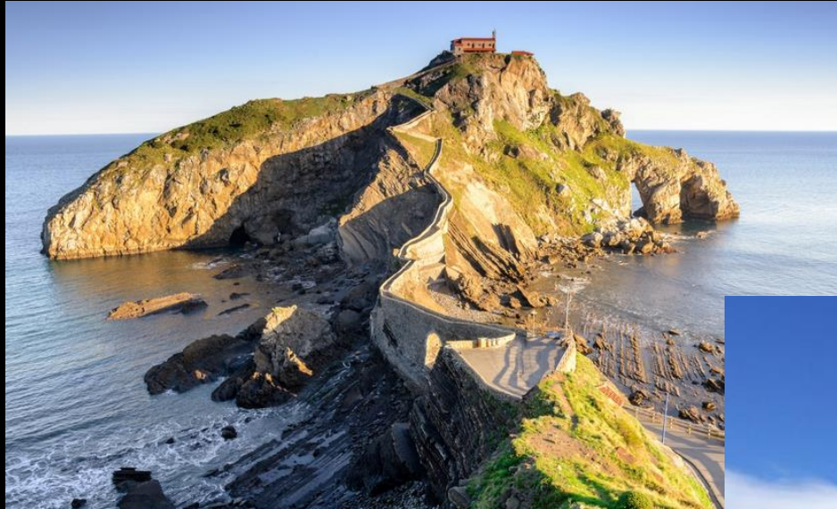
San Juan de Gaztelugatxe (Game of Thrones)